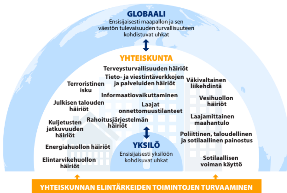
Kuva 3. Kansallinen riskiarvio 2023, Uhkamallit ja häiriötilanteet

Varautumisessa riskienhallinta on useiden eri tahojen yhteistyötä. Varautumisella varmistetaan tehtävien mahdollisimman häiriötön hoitaminen ja mahdollisesti tarvittavat tavanomaisesta poikkeavat toimenpiteet häiriötilanteissa ja poikkeusoloissa. Keusote osallistuu omalta osaltaan aktiivisesti yhteiskunnan elintärkeiden toimintojen turvaamiseen SOTE-organisaation vastuiden mukaisesti.