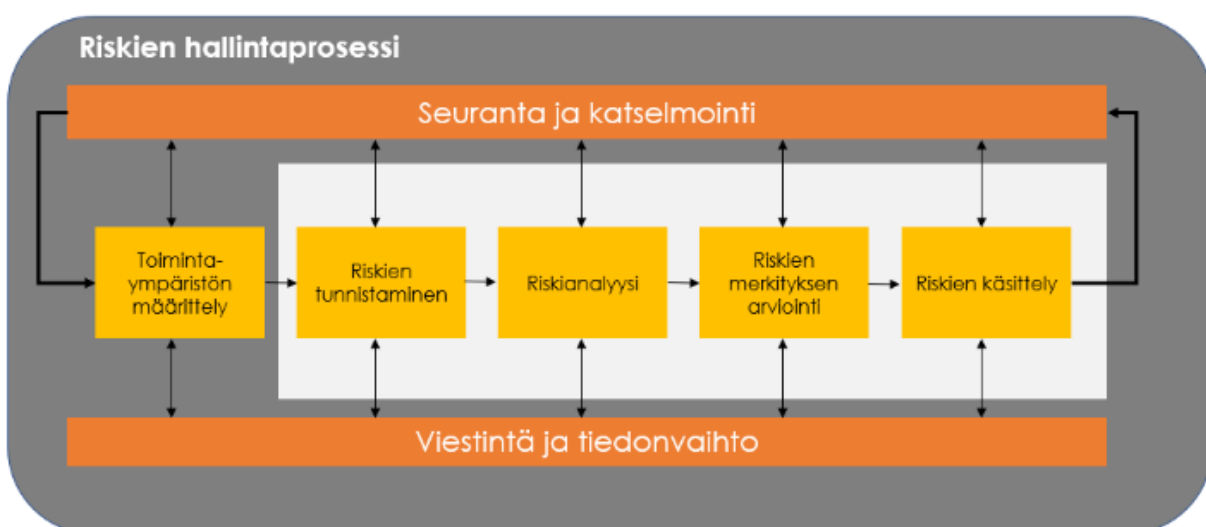
Kuva 5. Riskienhallintaprosessi. (SFS-ISO 31000)

Riskienhallintaprosessi sisältää olennaisena osana hallintaperiaatteita, menettelyjä ja käytäntöjen sekä järjestelmällistä soveltamista. Riskienhallintaprosessin keskiössä ovat riskien ja mahdollisuuksien tunnistaminen, arvottaminen, arviointi ja kontrollitoimenpiteet sekä riskien seuranta suhteessa valittuihin toimenpiteisiin.