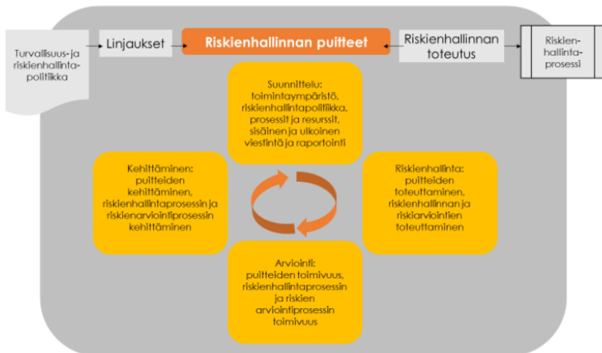
Kuva 6. Riskienhallinnan puitteiden avulla huolehditaan jatkuvasta kehitymisestä. (SFS-ISO 31000)

Riskienhallinnasta ennalta sovittuja päätöksiä ylläpidetään ja kehitetään osana johtamista ja toimintaprosesseja.