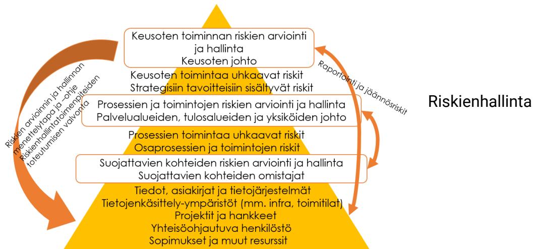
Kuva 2. Keusoten